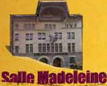
Rue de la Madeleine 10 1204 Genève / Accès: Bus 9 et 27 / Tram 12

Une saison compacte, nourrissante, où nous souhaitons vous rassembler autour du brasier de la créativité, et ce n'est pas tendance, mais on s'en fout, de la joie de vivre, du bonheur de jouer !